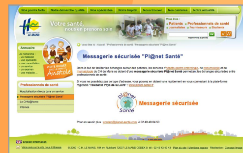
Information relayée sur le site web de l'hôpital

Depuis l'été, les services d'hépatogastro-entérologie, de pneumologie et de rhumatologie de l'hôpital du Mans utilisent la messagerie sécurisée Planet Santé pour les communications entre professionnels de santé (échanges hôpital-libéraux).