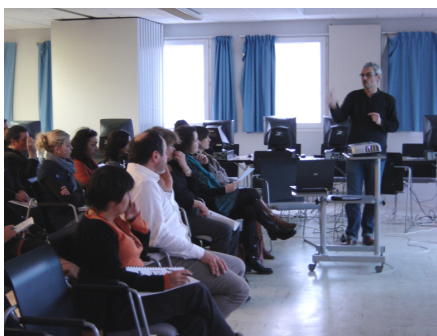
26 janvier 2010 : présentation du DPP

Nous considérons avoir réalisé un dossier complet et relativement simple qui balisera les questions essentielles qui doivent être posées lors d'un premier entretien. Les tests effectués par les professionnels volontaires montrent que l'utilisation technique est accessible à tous.