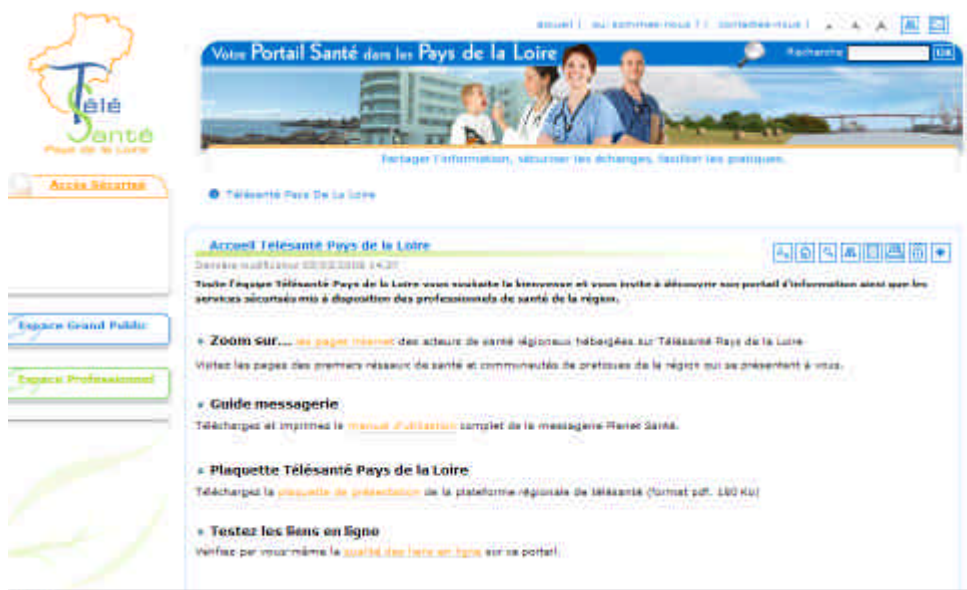
La page d'accueil du portail : www.telesante-paysdelaloire.fr